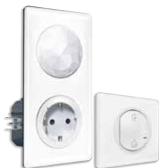
Βασικό kit εγκατάστασης White/Yesterday White