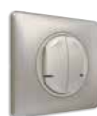
Ασύρματος διπλός διακόπτης Titanium/Titanium