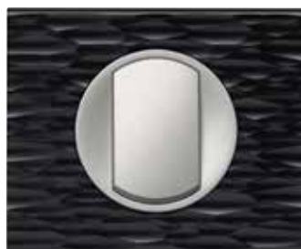
Corian® Black (*)