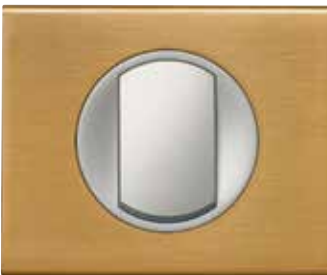
Brushed Gold Metal