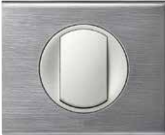
Brushed Stainless Steel