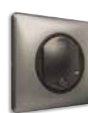
Ασύρματος διακόπτης Αφύπνισης/Υπνου Graphite/Tungsten