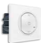
Συνδεδεμένος διακόπτης ρολών White/Yesterday White