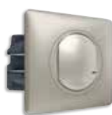
Συνδεδεμένος διακόπτης με δυνατότητα dimmer Titanium/Titanium