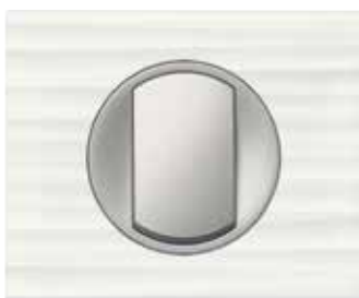
Corian® White (*)